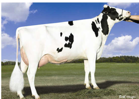
AMMON-PEACHEY SHANA FIFTH DAM